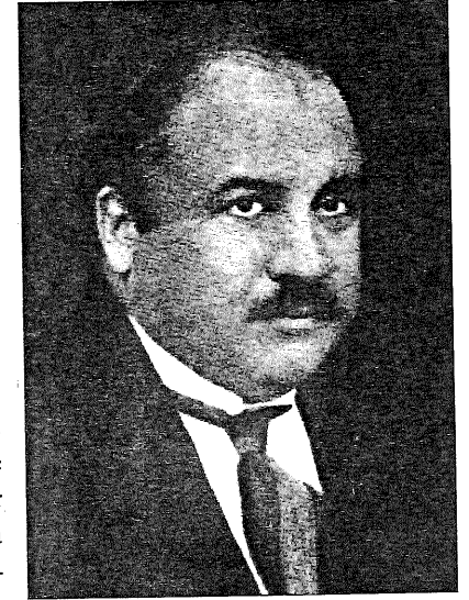
Türk milliyetçi düşüncesinin önemli isimlerinden Ziya Gökalp (1876-1924), korporatizmi savunurken özellikle siyasi partilerin temsiline önem veriyor, toplum içinde bireylerin "hak yerine vazife" düsturuyula hareket etmesini istiyordu.

Korporatizmin bir ideoloji olarak belirmesi 19. yüzyılın ortalarına denk düşmekle birlikte ne 19. yüzyılın son çeyreğinde ne de 20. yüzyılda tek bir korporatizmden söz açmak nerede ise imkansızdır. Bununla birlikte korporatizm, iki savaş arası dönemde oldukça popülerlik kazanmış bir akımdır. Öyle ki bu dönemde korporatist düşünce üzerine çok sayıda makale ve kitap yayımlanmış; kimi yazarlar, 20. yüzyılın 'korporatizm asrı' olacağını iddia etmiştir. Otoriteryan ya da görece demokratik korporatist örnekler ve din temelli ya da se-